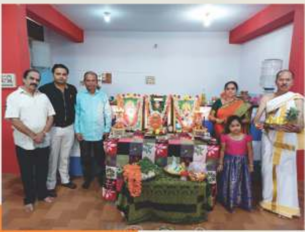
ತುಮಕೂರು ಶಾಖೆಯ ಉದ್ಘಾಟನೆಯ ಕುಭ ಸಂದರ್ಭ