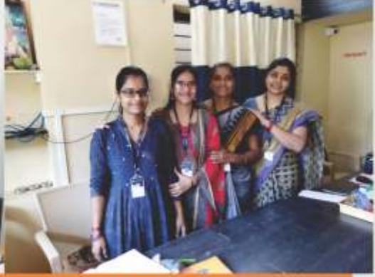
ಶಾಖೆಗಳಲ್ಲಿ ನಡೆದ ವಿವಿಧ ಸಾಂಸ್ಕೃತಿಕ ಕಾರ್ಯಕ್ರಮಗಳಲ್ಲಿ ಸಂಘದ ಒಬ್ಬಂದಿ ವರ್ಗ