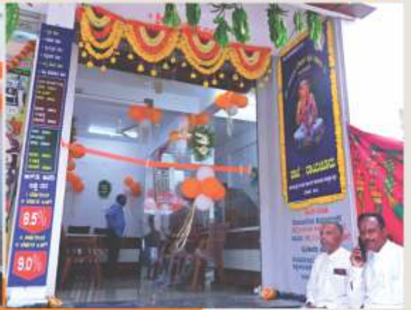
ರಾಯಚೂರು ಶಾಖೆಯ ಉದ್ಘಾಟನೆಯ ಪುನಃ ಸಂದರ್ಭದಲ್ಲಿ