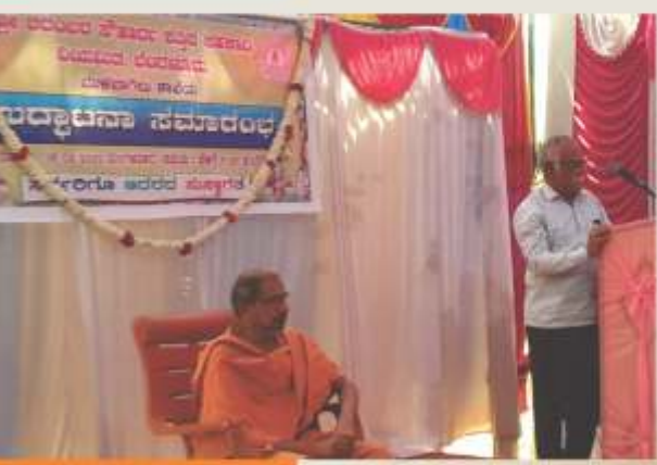
ಮುಳಬಾಗಿಲು ಶಾಖೆಯ ಉದ್ಘಾಟನೆಯ ಕುಭ ಸಂದರ್ಭ