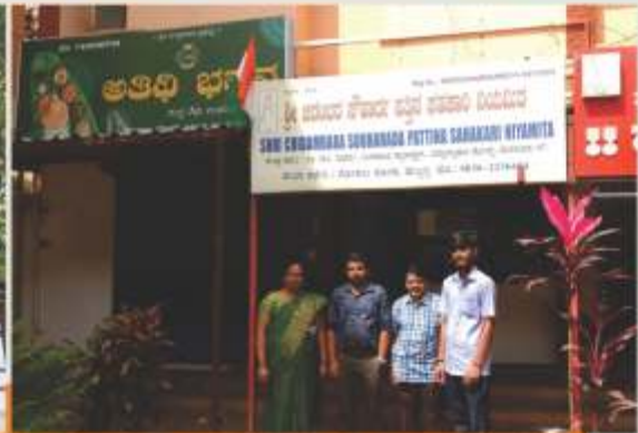
ಸ್ವಾತಂತ್ರ್ಯ ದಿನಾಚರಣೆಯ ಅಮೃತ ಮಹೋತ್ಸವದ ಕುಭ ಸಂದರ್ಭದಲ್ಲಿ ವಿವಿಧ ಶಾಖೆಗಳಲ್ಲಿ ಧ್ವಜಾರೋಹಣದ ಸಂಭ್ರಮ