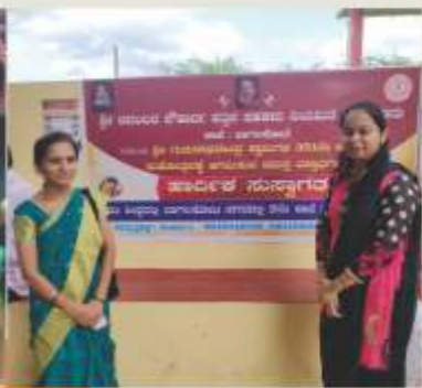
ವಿವಿಧ ಸಾಂಸ್ಕೃತಿಕ ಕಾರ್ಯಕ್ರಮಗಳಲ್ಲಿ ಸಂಘದ ಮಹಿಳಾ ಸದಸ್ಯೆಯರು