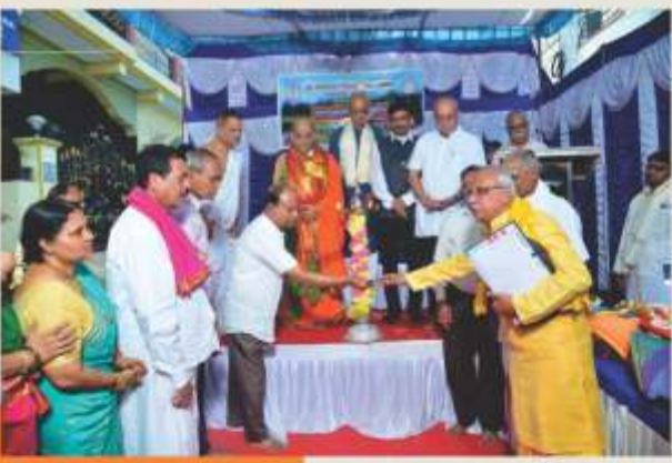
ಮೈಸೂರು ಶಾಖೆಯ ಉದ್ಘಾಟನೆಯ ಕುಭ ಸಂದರ್ಭ