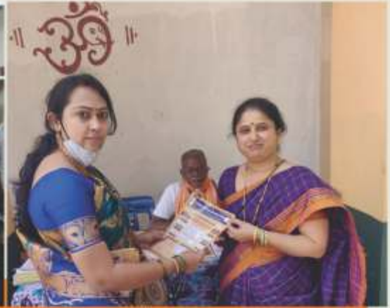
ಶಾಖೆಗಳಲ್ಲಿ ನಡೆದ ವಿವಿಧ ಸಾಂಸ್ಕೃತಿಕ ಕಾರ್ಯಕ್ರಮಗಳಲ್ಲಿ ಸಂಘದ ಒಬ್ಬಂದಿ ವರ್ಗ